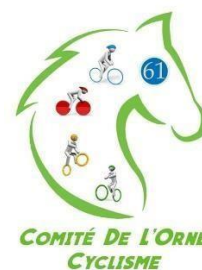
Comité de l'Orne Cyclisme