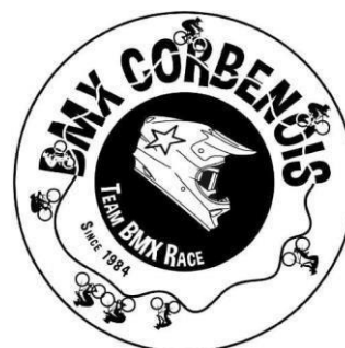
Président du BMX Corbenois Pays d'Alençon