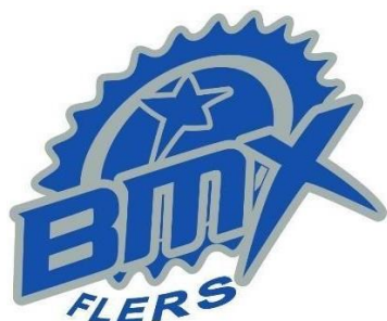
Présidente du BMX club de Flers

Le fait de participer au Trophée 61 implique l'acceptation du règlement et une participation financière de 150,00 € par club ornais et du Comité de l'Orne Cyclisme.