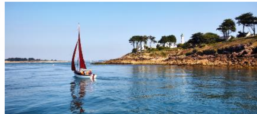
OT Rhuys.